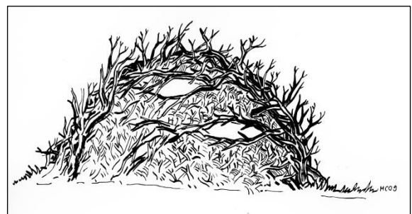
Asthaufen: Beim Bau sollte grobes und feines Material verwendet werden.